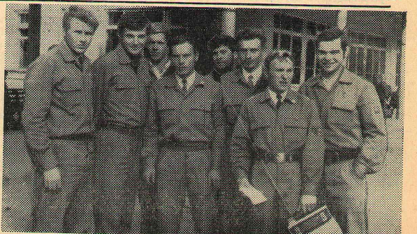
На снимке: бойцы стройотряда «Интеграл-70».