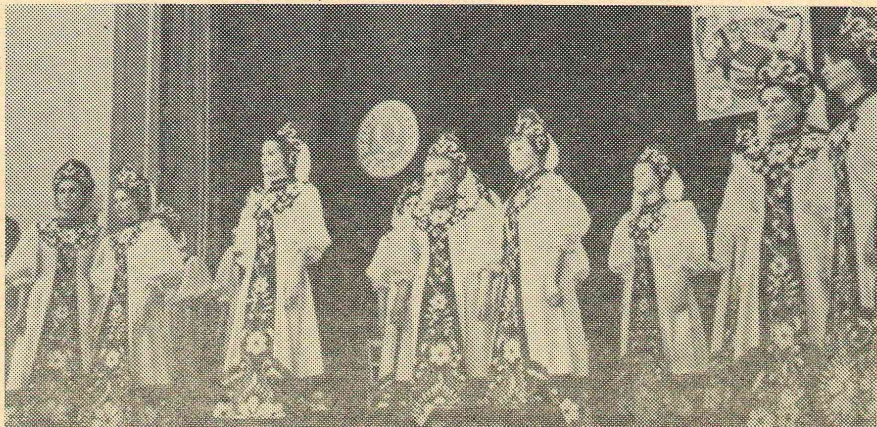
Поет народный хор в составе студенток I курса.