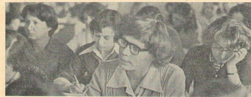
Первокурсники слушают лекцию.

В. ПЛЕХАНОВ, кандидат педагогических наук.