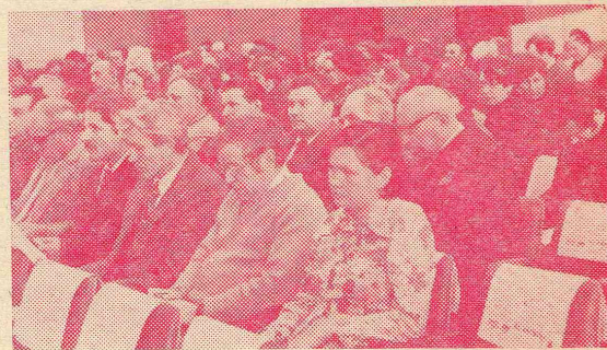
Материалы с партийного собрания сделал В. М. СОБИНОВ.

Партийное собрание приняло развернутое постановление, избрало новый состав партийного комитета, комиссий народного контроля и делегатов на районную партконференцию.