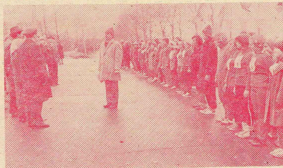
В эти дни прошла легкоатлетическая эстафета в честь