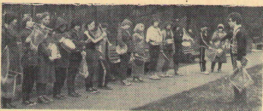
Учимся горнить и барабанить.