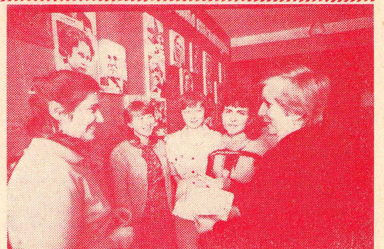
Выпускники иняза перед распределением.