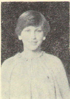
Я — СТУДЕНТКА!