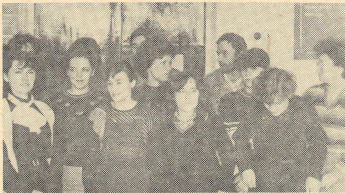
НА СНИМКЕ: студенты 42 группы исторического факультета.

Девушки этого курса неповторимы. Их улыбка обаятельна, взгляд приветлив.