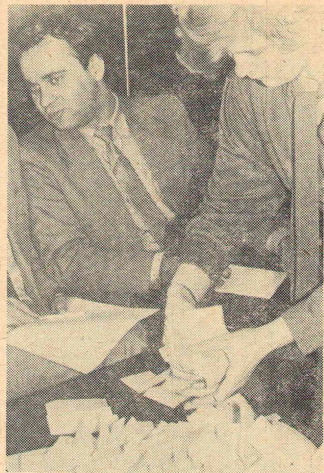
Идет подсчет бюллетеней